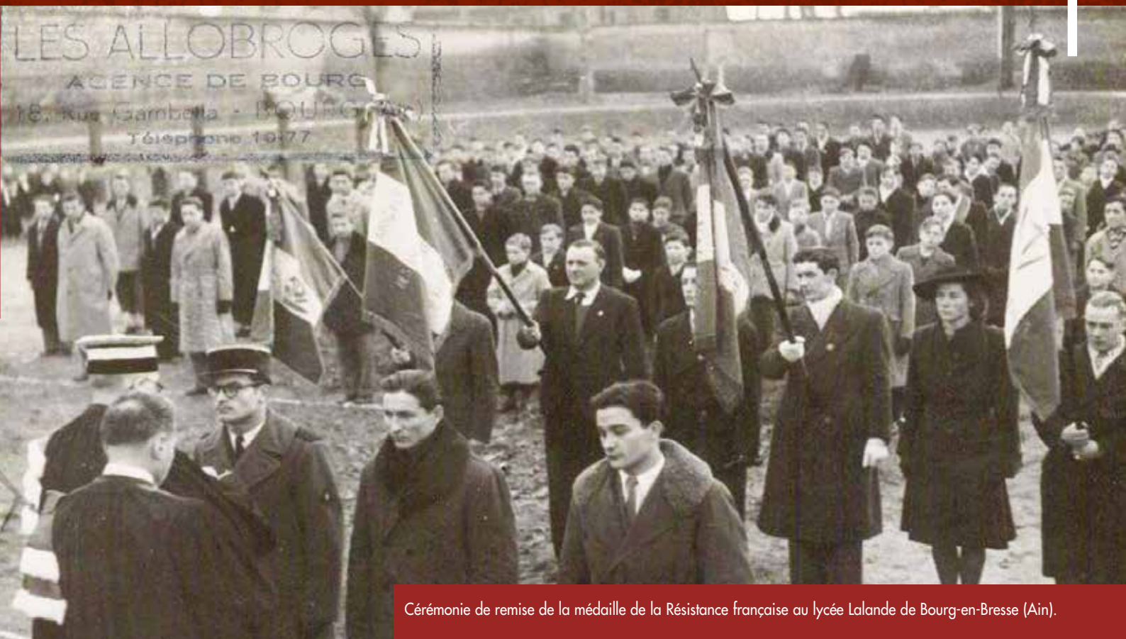
Cérémonie de remise de la médaille de la Résistance française au lycée Lalande de Bourg-en-Bresse (Ain).