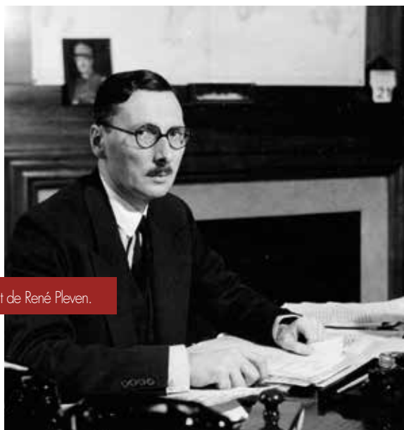
Portrait de René Pleven.

un constat déprimant, devant « les jeunes Français qui se sont engagés chez nous (en principe, donc, les meilleurs) et qui sont lamentables. ». Ici, l'identité Française libre joue à plein. Ce qu'il perçoit des conséquences de Vichy et de l'Occupation sur les Français (perte de sensibilité et médiocrité des idéaux après quatre ans de pénuries?), il l'oppose à la mentalité de ses hommes : cette « division où l'esprit est si beau et si propre à redresser quatre ans de déformation honteuse. ». Cette discordance renforce son inquiétude : « La France ne saura jamais assez combien elle doit à ces braves étrangers ou à ces braves tirailleurs qui souffrent pour elle. Ce sont des saints, priez un peu pour eux, car tout le monde semble les oublier » (lettre à sa mère, 20 octobre 1944).