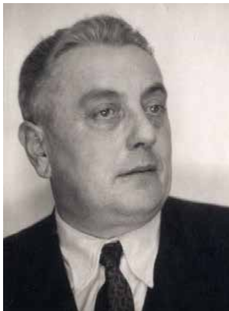
Archives du Sénat.

S'il leur arriva de s'opposer sur des questions de méthode et de présence, les résistants de l'intérieur et les Français combattants tombèrent en revanche d'accord pour mobiliser les ressorts qui les avaient conduits à dire « non » afin de piloter collectivement au mieux la sortie de guerre du pays. Ils œuvrèrent notamment pour éviter à ceux que la cessation des hostilités avait transformés en anciens ennemis de subir un sort arbitraire et sommaire. Ils agirent pour que les Allemands prisonniers ne subissent pas la vindicte de populations poussées à bout par les rigueurs, les abus, voire les atrocités de l'occupation. Ils firent en sorte que l'ancien ennemi intérieur, vichyste, collaborationniste ou milicien, soit décentement traité. La mise en place et le contrôle de l'épuration se trouvèrent ainsi au cœur de l'ultime étape de leur combat (14) .