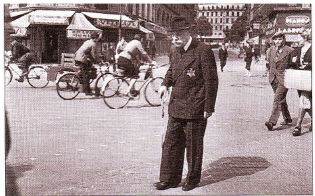
▲ 2. Vieil homme juif dans Paris occupé. À partir de 1942, les Juifs sont obligés de porter une étoile jaune sur leurs vêtements.