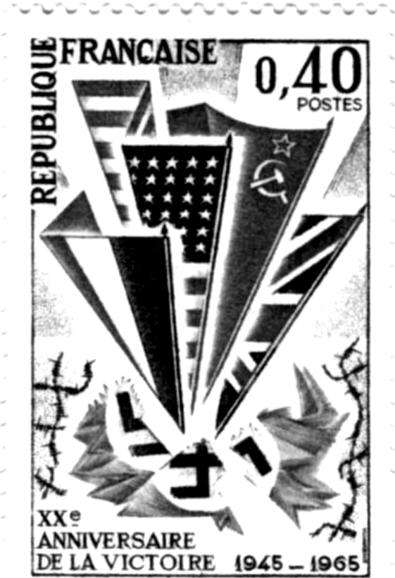
Document 3 : Timbre-poste français émis en 1965