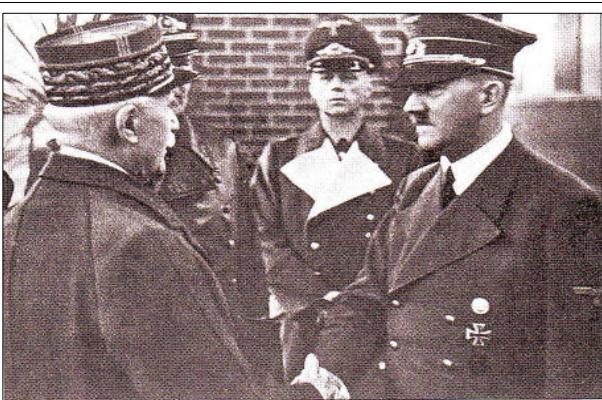
▲ 1. Adolf Hitler et le maréchal Pétain se rencontrent à Montoire-sur-le-Loir, en 1940.

Pendant que certains, comme le maréchal Pétain, collaborent avec l'occupant nazi et se mettent à son service (> doc.1) – et même combattent sous l'uniforme allemand -, d'autres résistent.