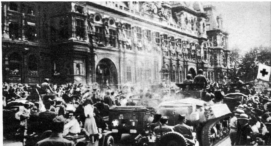
4. La libération de Paris.