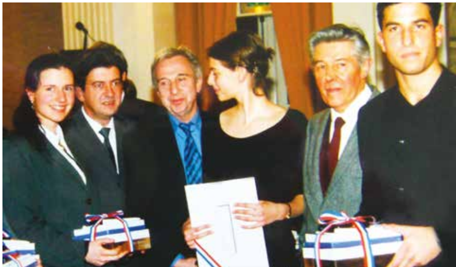
Journal Le Déporté / photo Daniel Blondel

Peu à peu, il s'investit dans les associations de résistants et de déportés et notamment à l'amicale de Mauthausen. À partir des années 1960, désireux de transmettre son « expérience unique », qu'il décrit lui-même comme « une rupture, quelque chose d'« extra ordinaire », d'extérieur à [son] être, qui tranche avec le reste de [sa] vie (1) », il intervient régulièrement devant des élèves dans le cadre du Concours national de la Résistance et de la Déportation. Cependant, s'il mesurait le caractère précieux et irremplaçable du témoignage auprès des élèves, il savait aussi combien pouvait être grand le fossé existant entre la parole des témoins et la compréhension de ses auditeurs surtout en ce qui concerne le vécu concentrationnaire.