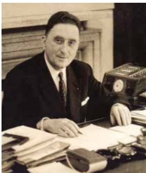
Ministère de l'Éducation nationale