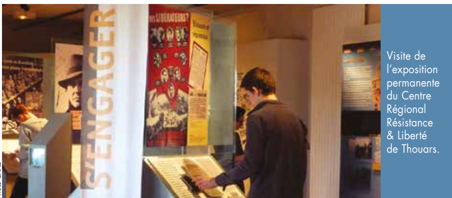
Visite de l'exposition permanente du Centre Régional Résistance &amp; Liberté de Thouars.

Pour préparer le CNRD, les ressources locales sont à mon sens primordiales. Le CNRD permet aux élèves de découvrir leur territoire, de s'initier à la recherche historique en se confrontant aux archives ou en questionnant les familles. Le CRRL, en s'appuyant sur ses fonds propres d'archives et en tissant des partenariats avec les Archives départementales, met en ligne des documents que chacun peut consulter. Nous sommes très attentifs à ce que les territoires ruraux isolés du département aient accès aux ressources malgré la distance géographique. Bien sûr, des thèmes sont plus propices à l'étude de la dimension locale, comme par exemple « Communiquer pour résister » (session 2012-2013) ou « 1940. Entrer en résistance. Comprendre, refuser, résister » (session 2019-2021) qui ont permis de prendre appui sur l'histoire du territoire pour faire émerger des questions universelles et permettre aux plus jeunes de porter un regard sur le monde d'aujourd'hui. ■