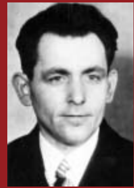
Gedenkstätte Deutscher Widerstand-Berlin

Johann Georg Elser, auteur solitaire de l'attentat du 8 novembre 1939 à Munich.