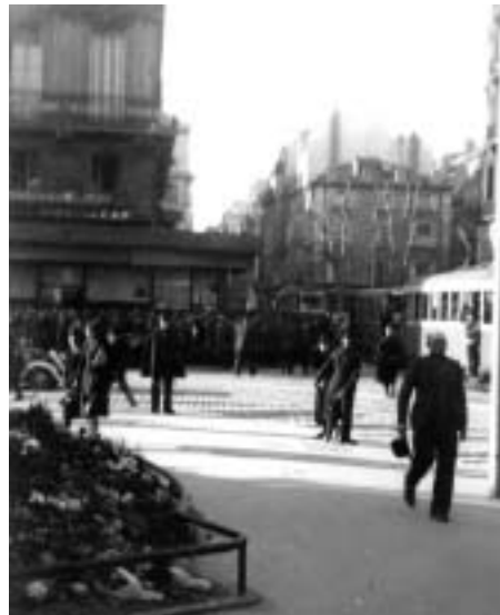
Marseille, le 28 mars 1941, manifestation hostile à l'Axe. Une foule nombreuse vient fleurir le monument de la préfecture à la mémoire du roi Alexandre I er de Yougoslavie. Sur le cliché de gauche, un homme se découvre en passant devant le monument.