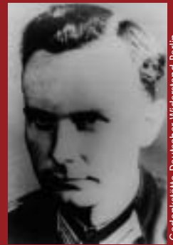
Gedenkstätte Deutscher Widerstand-Berlin

Peter Graf Yorck von Wartenburg (1904-1944). Juriste, il est enrôlé dans la Wehrmacht comme officier de réserve. Il est muté en 1942 à l'état-major des questions économiques de l'Est, au haut commandement de la Wehrmacht à Berlin. Il se rapproche de l'opposition militaire et s'engage activement au sein du « Cercle de Kreisau ». Condamné à mort par le Volksgerichtshof le 8 août 1944, il est exécuté le même jour à Berlin-Plötzensee.