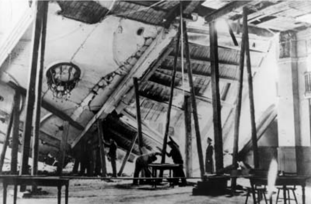
Gedenkstätte Deutscher Widerstand-Berlin