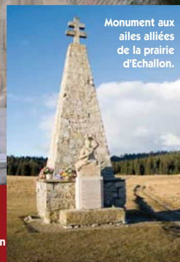
Monument aux ailes alliées de la prairie d'Echallon.