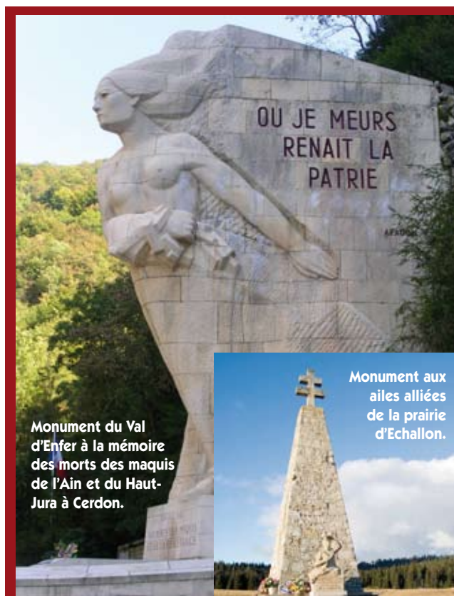
Monument du Val d'Enfer à la mémoire des morts des maquis de l'Ain et du Haut-Jura à Cerdon.

• Commémoration au monument aux martyrs de la Résistance de Saint-Didier-de-Formans édifié à la mémoire des 28 prisonniers extraits des geôles de Montluc à Lyon et fusillés en rase campagne au lieu-dit « Les Roussilles », sur la commune de Saint-Didier-de-Formans, le 16 juin 1944. L'historien Marc Bloch faisait partie des victimes. ●