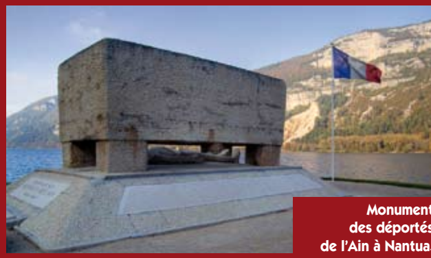
Monument des déportés de l'Ain à Nantua.