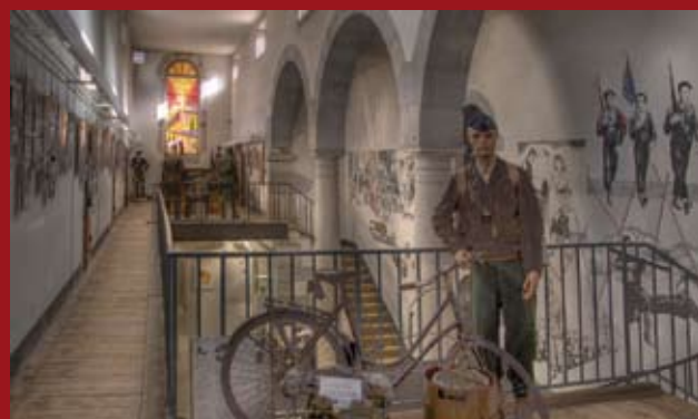
Vue intérieure du Musée départemental d'Histoire de la Résistance et de la Déportation de l'Ain et du Haut-Jura à Nantua.