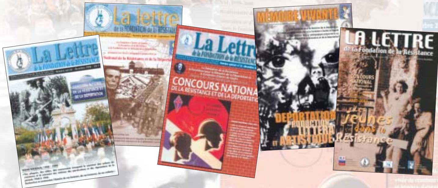
Depuis 1993, la Fondation de la Résistance rejointe par la Fondation pour la Mémoire de la Déportation et la Fondation Charles de Gaulle réalisent et diffusent gratuitement une brochure pédagogique aux candidats préparant le Concours.

enseignant se renouvelle. Si l'on peut invoquer la « concurrence » (légitime) d'autres périodes historiques contemporaines (en particulier celle des guerres coloniales et de la décolonisation) ou celle d'autres concours pour lesquels les professeurs d'histoire-géographie sont fortement sollicités, les pratiques pédagogiques ont pu aussi avoir des incidences.