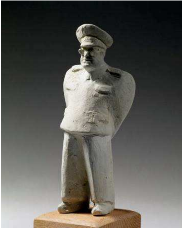
Econome de la prison de Trèves 14.5 x 6 cm Sculpture terre, non daté Musée de la Résistance et de la Déportation de Besançon