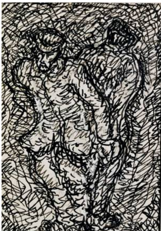
Prisonniers liés dos à dos Hinzert, 9.8 x 6.8 cm Dessin à l'encre sur papier, non daté Musée de la Résistance et de la Déportation de Besançon