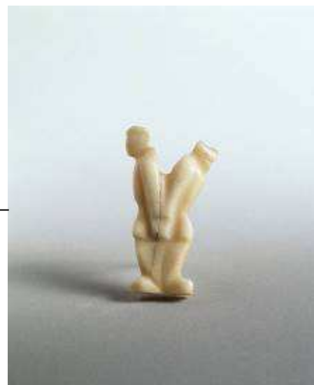
Prisonniers liés de dos 4 x 2 cm Sculpture en os poli, non daté Musée de la Résistance et de la Déportation de Besançon