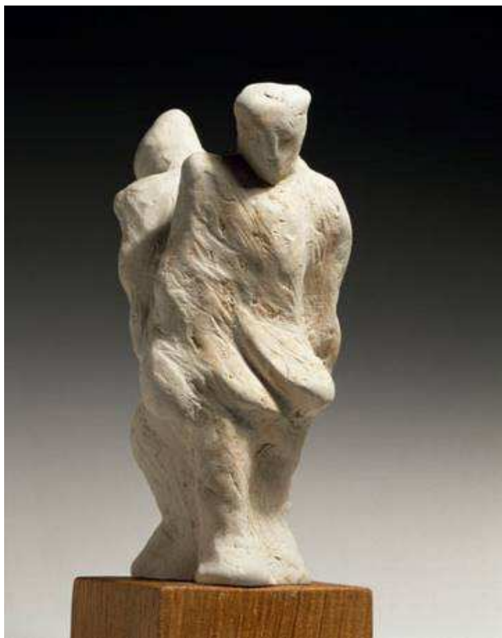
Prisonniers liés dos à dos 13 x 8 cm Sculpture terre blanche, non daté Musée de la Résistance et de la Déportation de Besançon