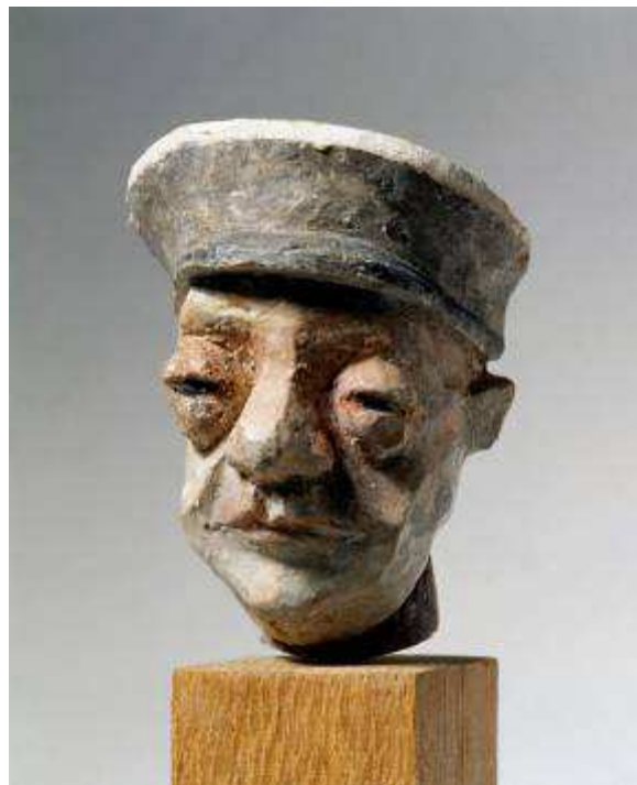
Gardien 8 x 6 cm Sculpture terre colorée, non daté Musée de la Résistance et de la Déportation de Besançon