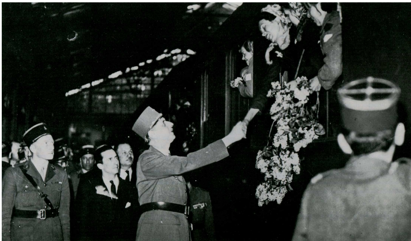
Le général de Gaulle reçoit les premières rescapées de Ravensbrück le 5 avril 1945.