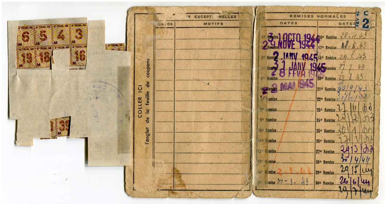
Carte d'alimentation, octobre 1944-mai 1945