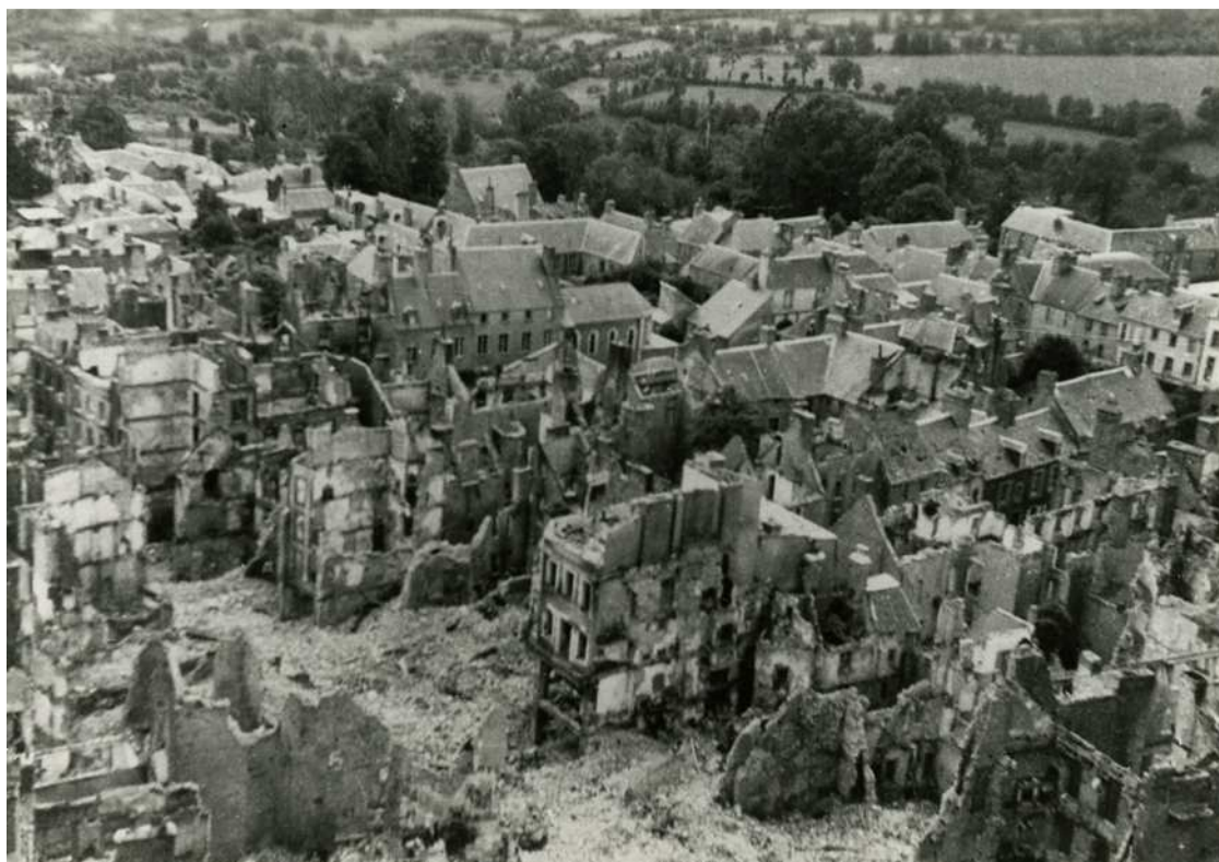
Vue de Coutances