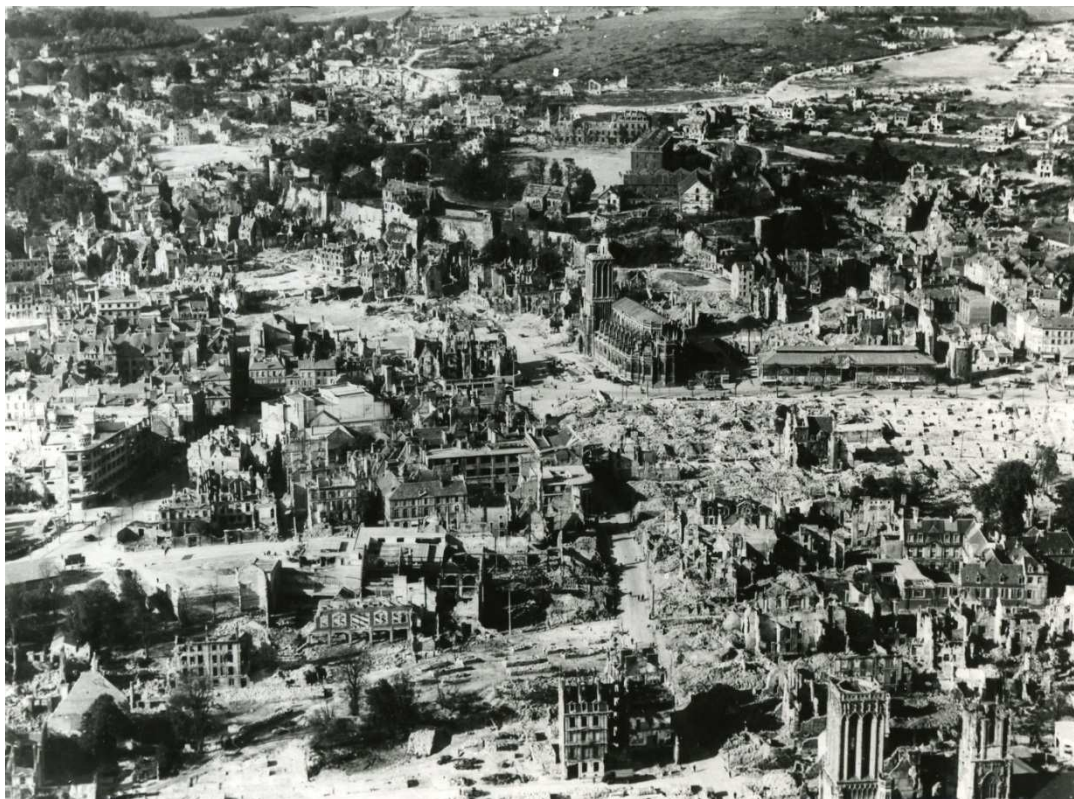
Vue des destructions de Caen