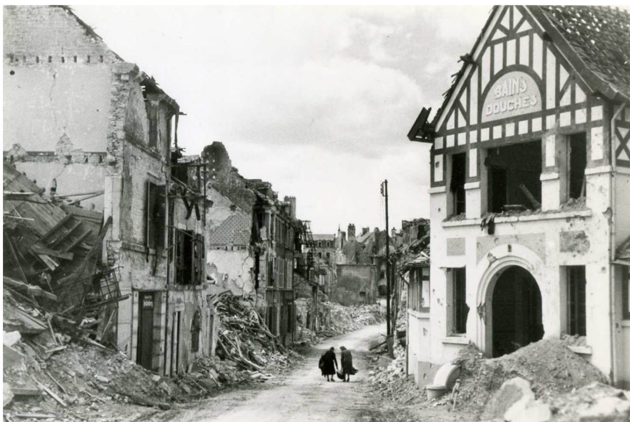
Vue de Falaise