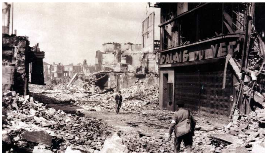
Vue de Lisieux