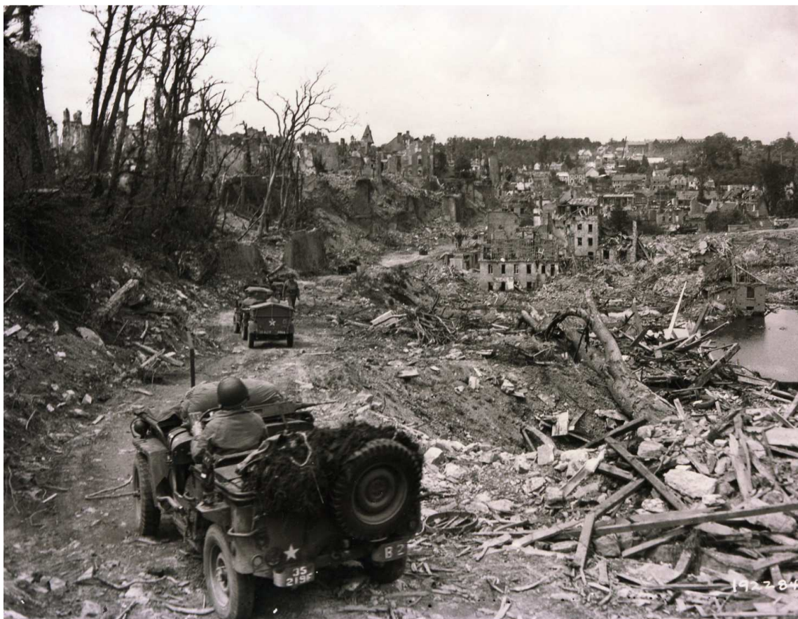
Vue de Saint-Lô