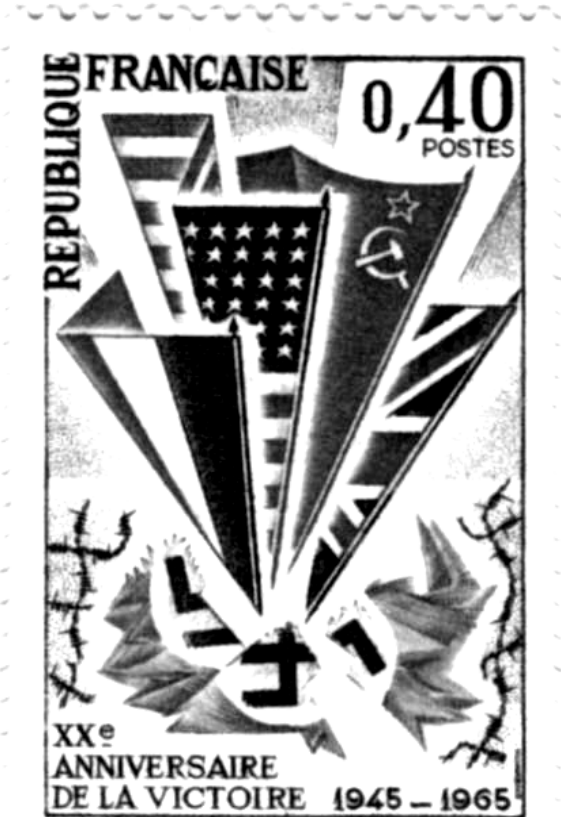
Document 3 : Timbre-poste français émis en 1965