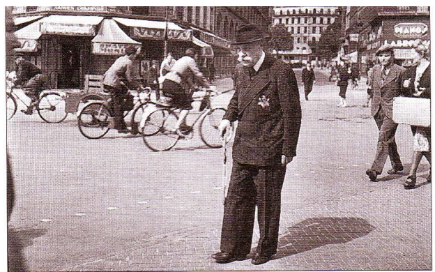
▲ 2. Vieil homme juif dans Paris occupé. À partir de 1942, les Juifs sont obligés de porter une étoile jaune sur leurs vêtements.