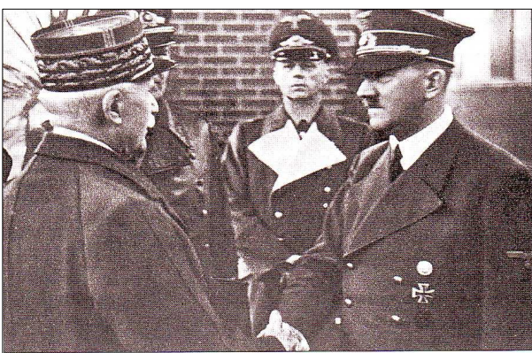
▲ 1. Adolf Hitler et le maréchal Pétain se rencontrent à Montoire-sur-le-Loir, en 1940.

Pendant que certains, comme le maréchal Pétain, collaborent avec l'occupant nazi et se mettent à son service (> doc.1) – et même combattent sous l'uniforme allemand -, d'autres résistent.