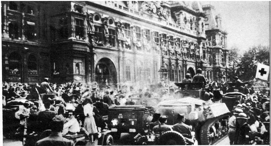
4. La libération de Paris.